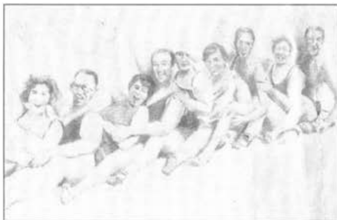
בצעוניות מונוכרומטיות. "ללא כותרת" של מריון פוקס